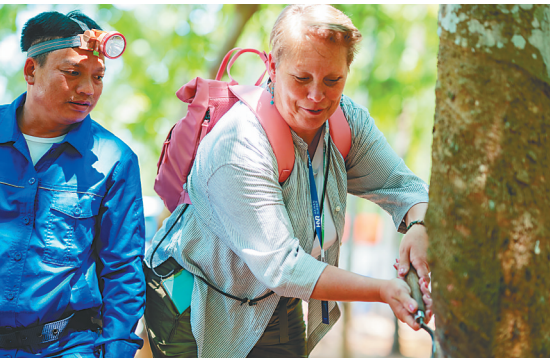
海南橡胶海外下属企业职工体验割胶。