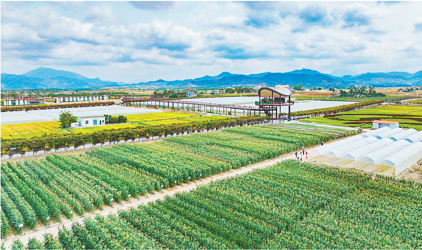
俯瞰三亚市崖州区国家现代农业产业园。(资料图)