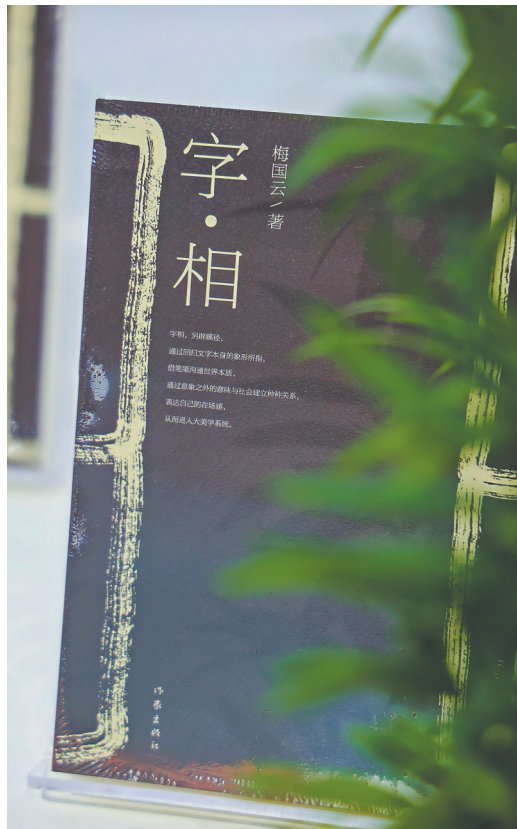
梅国云新作《字·相》。资料图

近日，梅国云《字·相》艺术分享会在海口举办，同时进行了《字·相》作品的首次展览。