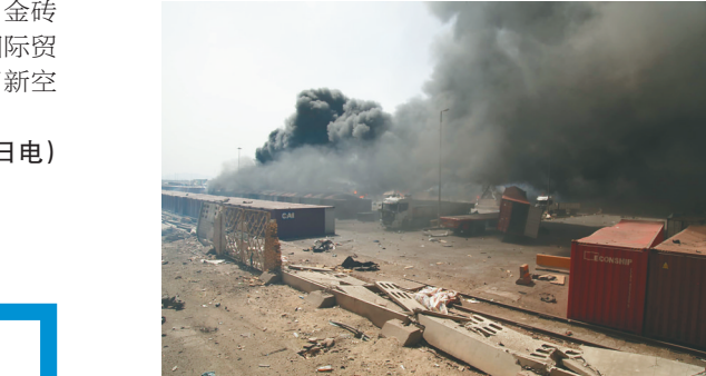
4月26日拍摄的伊朗南部沙希德拉贾伊港爆炸现场的照片。

据新华社德黑兰4月26日电（记者陈霄 沙达提）据伊朗国家电视台26日报道，伊朗南部沙希德拉贾伊港当天发生的爆炸事件已造成5人死亡、超过700人受伤。