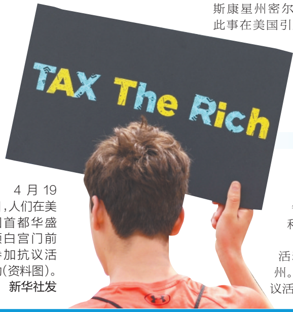
4月19日，人们在美国首都华盛顿白宫门前参加抗议活动（资料图）。

美国12个州日前组成联盟，向位于纽约的美国国际贸易法院起诉特朗普政府，指控其关税政策为“一时兴起，而非合法权力的正当行使”，要求法院裁定“对等关税”非法，并阻止其实施。 特朗普政府自1月20日上任以来，肆意挥舞“关税大棒”，强推移民驱逐计划，大幅裁撤联邦雇员，大量关停政府机构，一系列行动引发众怒。据美国法律研究机构统计，特朗普政府在美国国内面临的诉讼已达200余起。 分析人士认为，司法与行政对立，正在进一步加剧美国政治混乱和社会撕裂，引发宪政危机，令特朗普政府的政策实施面临巨大阻力。