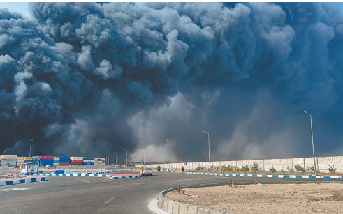
4月26日，伊朗沙希德拉贾伊港的爆炸现场冒出浓烟。

据新华社德黑兰4月27日电（记者陈霄 沙达提）据伊朗伊斯兰共和国通讯社27日报道，伊朗南部沙希德拉贾伊港26日发生的爆炸已造成36人死亡。另据伊朗塔斯尼姆通讯社消息，沙希德拉贾伊港的灭火行动已进入最后阶段，火势已经平息。 伊朗政府发言人穆哈杰拉尼27日宣布，伊朗4月28日将举行全国哀悼。 沙希德拉贾伊港26日发生爆炸。据伊朗媒体报道，爆炸威力巨大，周围建筑物大多严重受损，50公里外都能听到爆炸声。爆炸产生巨大浓烟，导致大范围空气污染。港口所在的阿巴斯市已于27日要求所有学校关闭。 塔斯尼姆通讯社援引伊朗国防部27日发表的声明报道说，在事发地区和整个沙希德拉贾伊港都没有用于军事用途的进出口货物。伊朗国家安全委员会发言人27日在社交媒体上发布消息说，从初步信息来看，这起爆炸事件与国家安全事务无关。