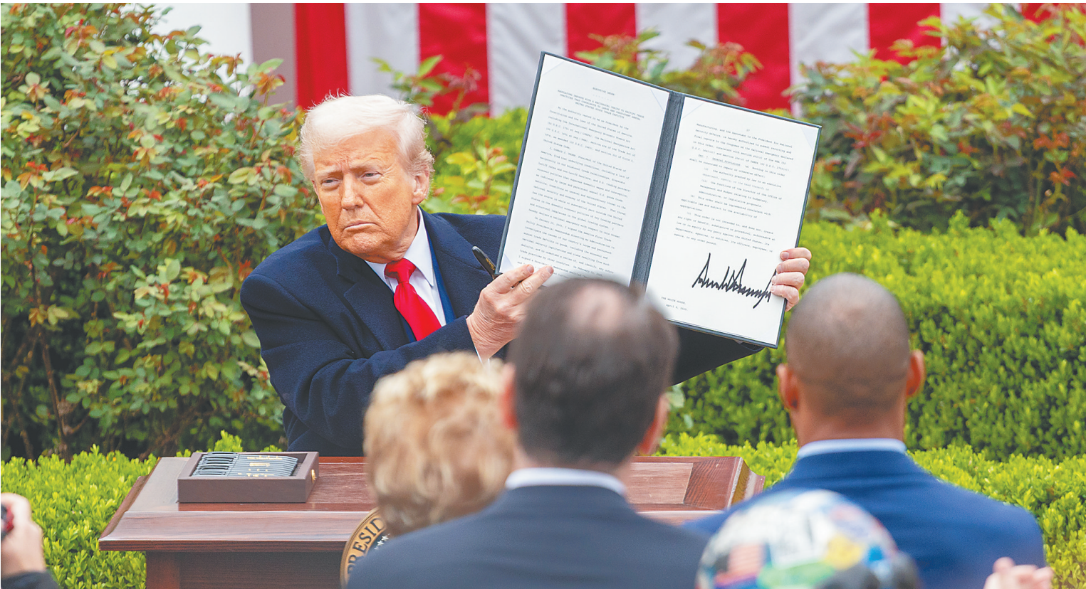
美国总统特朗普在华盛顿白宫展示签署后的关于所谓「对等关税」的行政令资料图。

美国12个州日前组成联盟，向位于纽约的美国国际贸易法院起诉特朗普政府，指控其关税政策为“一时兴起，而非合法权力的正当行使”，要求法院裁定“对等关税”非法，并阻止其实施。 特朗普政府自1月20日上任以来，肆意挥舞“关税大棒”，强推移民驱逐计划，大幅裁撤联邦雇员，大量关停政府机构，一系列行动引发众怒。据美国法律研究机构统计，特朗普政府在美国国内面临的诉讼已达200余起。 分析人士认为，司法与行政对立，正在进一步加剧美国政治混乱和社会撕裂，引发宪政危机，令特朗普政府的政策实施面临巨大阻力。