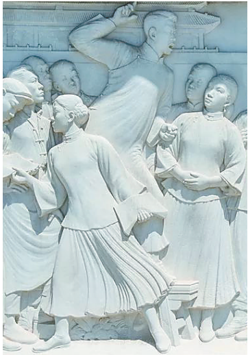
五四运动浮雕。资料图