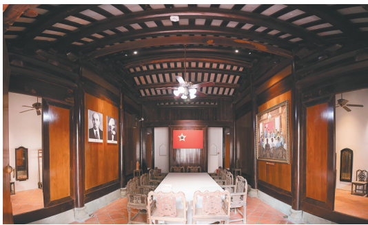
中共琼崖一大会议址内景。

在武装反抗国民党反动派的斗争中,涌现出了许多的英雄儿女。如琼山的杰出妇女代表刘秋菊,1927年10月琼山县塔市乡成立农民赤卫队时,她第一个报名。她还经常和赤卫队员一起,破坏公路、桥梁、割断电线,阻止敌人“扫荡”。她还组织一支妇女运输队,多次把斗争没收地主恶霸的物资送给琼山县委,成为威震敌胆的“女飞将”。