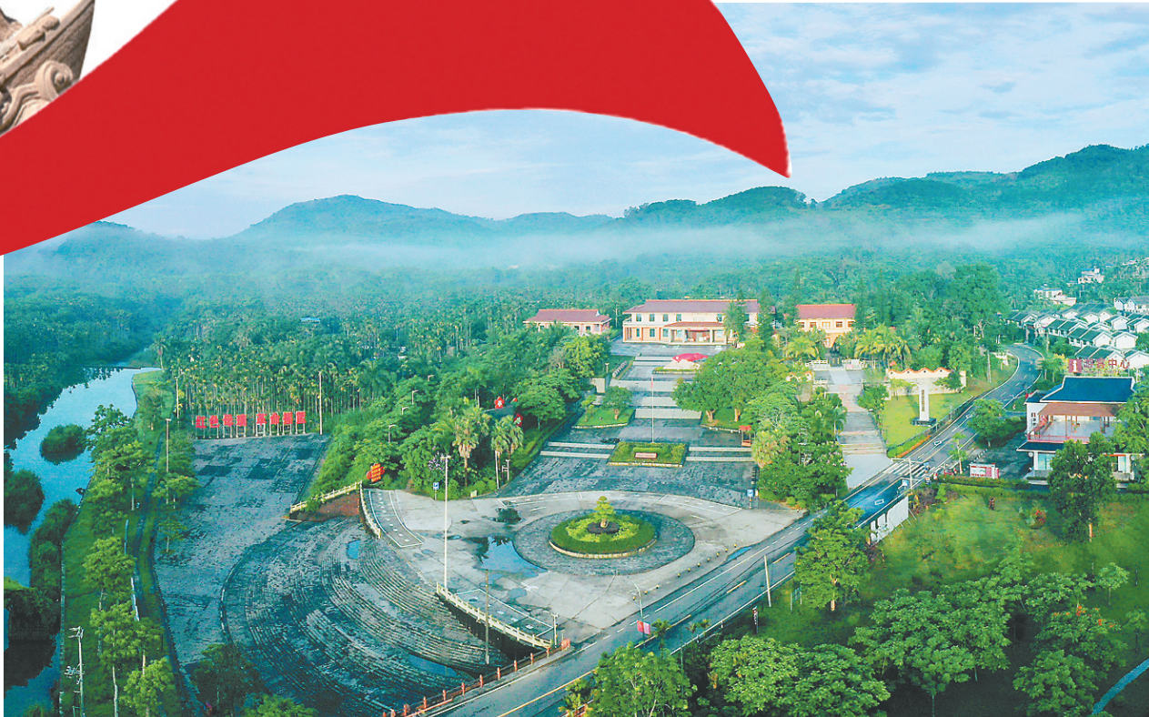
俯瞰母瑞山革命根据地纪念馆。