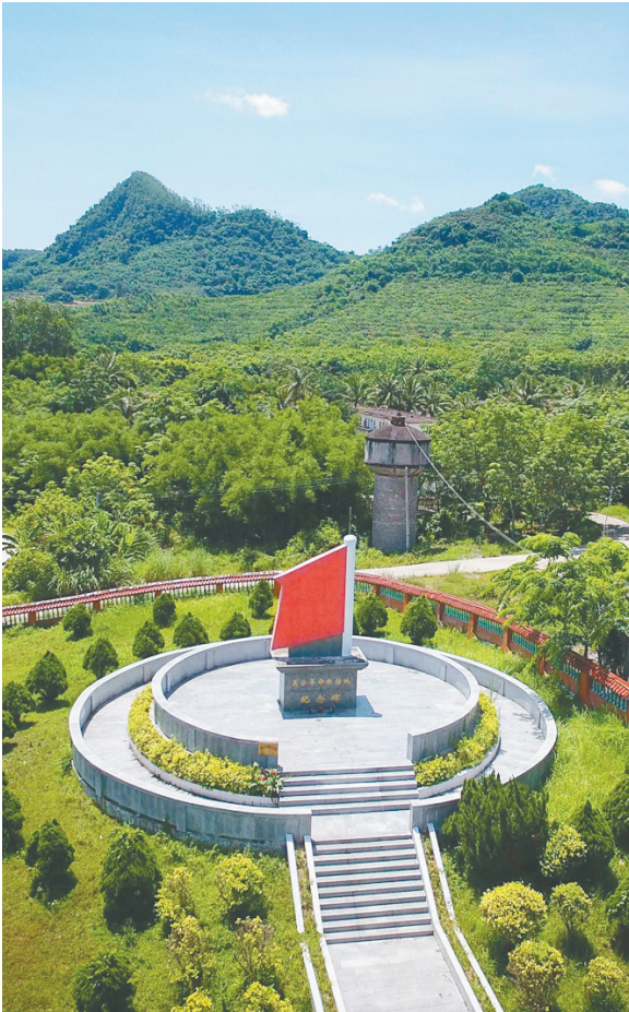
澄迈美合革命根据地纪念碑。

1930年8月，琼崖红军独立团扩编为红军独立师。琼崖革命根据地成为当时国内有影响的革命根据地之一。