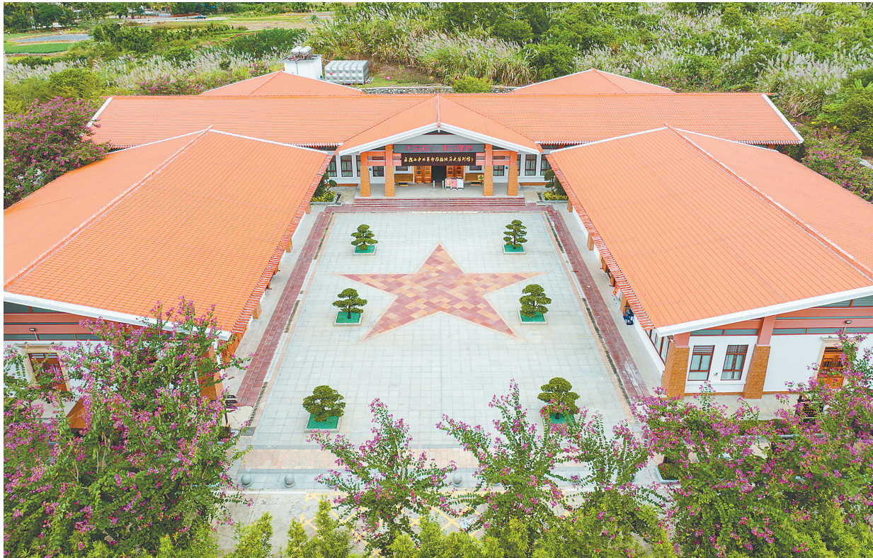
俯瞰五指山革命根据地纪念馆陈列馆。

大革命失败后，琼崖共产党人转移到农村，领导农民打土豪、分田地，于1927年底掀起琼崖第一次土地革命高潮。