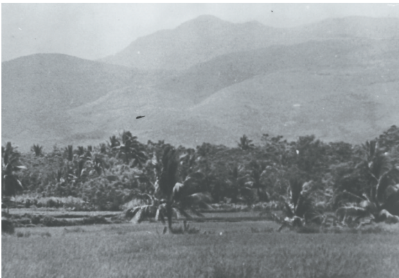
上世纪80年代初的母瑞山。本版图片除署名外均为资料图

1937年7月7日，日本发动全面侵华战争。国共两党在抗日统一战线的号召下，共同抵御外敌。1938年12月5日，琼崖红军游击队改编部队番号为“广东民众抗日自卫团第十四区独立队”（简称琼崖抗日独立队，后扩充为琼崖抗日独立总队、独立纵队），辖3个中队和1个特务小队，有300多人，成为琼崖抗日先锋，史称云龙改编。