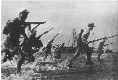
参加解放海南岛战役的战士涉水登陆。