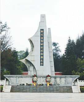
解放海南岛战役烈士陵园纪念碑。

答：解放海南岛战役是解放华南的收官之战，我军以木帆船突破国民党海空封锁，成功登陆并解放海南岛。在这场战役中，许多英烈献出了宝贵的生命。根据1950年5月8日第四野战军司令部《四十三、四十军渡海作战战绩》统计，共负伤3099人、牺牲784人、失踪619人，以上共计伤亡4500余人。根据《海南英烈谱》及续篇的记载，截至2023年底，共收录有名有姓的烈士1301人。