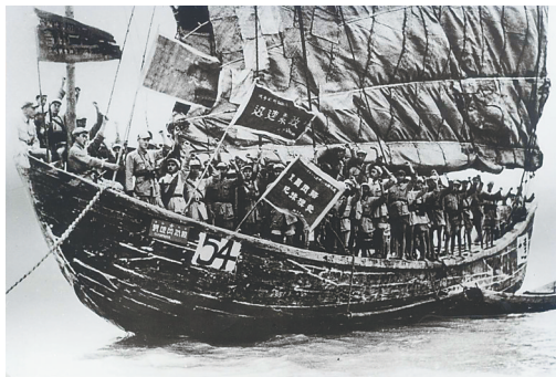
参加解放海南岛战役的将士发船时宣誓。