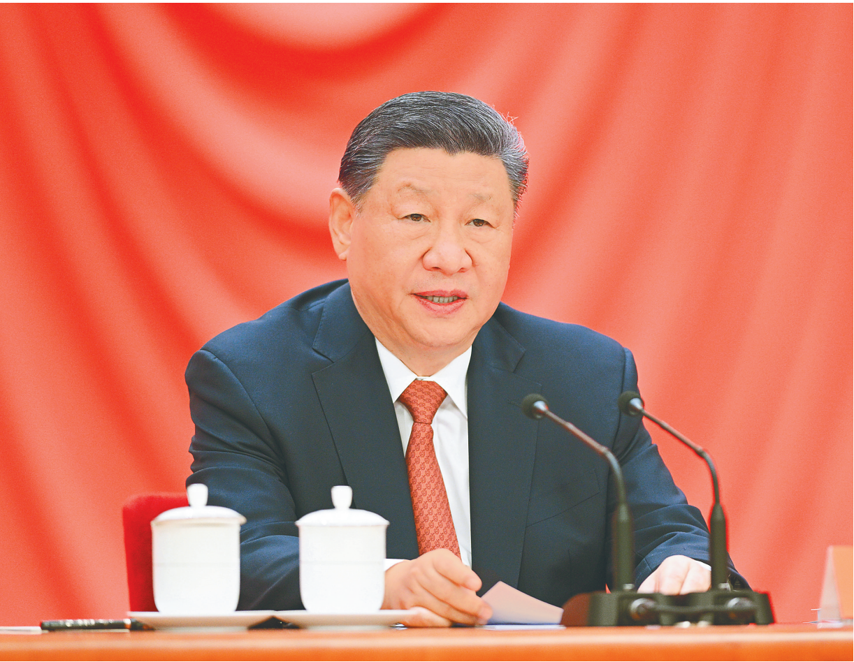
4月28日,庆祝中华全国总工会成立100周年暨全国劳动模范和先进工作者表彰大会在北京人民大会堂隆重举行。中共中央总书记、国家主席、中央军委主席习近平出席大会并发表重要讲话。

新华社北京4月28日电 庆祝中华全国总工会成立100周年暨全国劳动模范和先进工作者表彰大会28日上午在人民大会堂隆重举行。中共中央总书记、国家主席、中央军委主席习近平出席大会并发表重要讲话强调,新时代新征程,必须紧紧围绕党的中心任务,汇聚起工人阶级和广大劳动群众的磅礴力量,脚踏实地、奋发进取、拼搏奉献,一步一