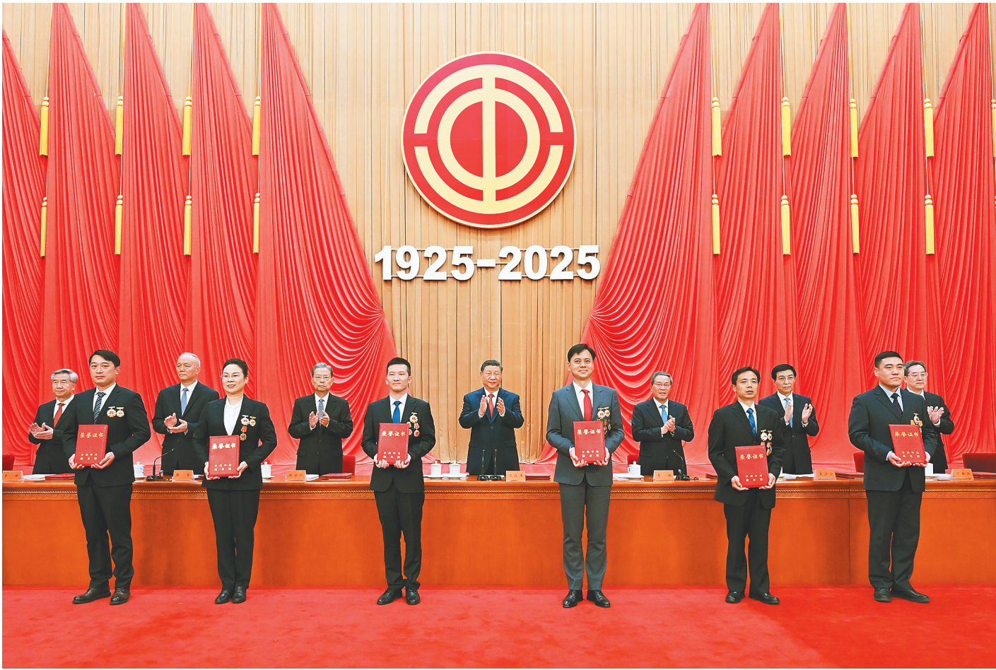
4月28日,庆祝中华全国总工会成立100周年暨全国劳动模范和先进工作者表彰大会在北京人民大会堂隆重举行。这是习近平等党和国家领导人为全国劳动模范和先进工作者代表颁发荣誉证书。新华社记者 谢环驰 摄

人民大会堂大礼堂气氛隆重热烈。主席台上方悬挂着“庆祝中华全国总工会成立100周年暨全国劳动模范和先进工作者表彰大会”会标,后幕正中悬挂中国工会会徽,会徽下方是“1925-2025”字标,10面红旗分列两侧。二楼眺台悬