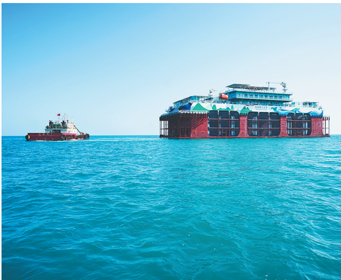
第3座深远海智能养殖旅游平台“龙栖湾公主号”抵达乐东龙栖湾国家级现代智慧海洋牧场。