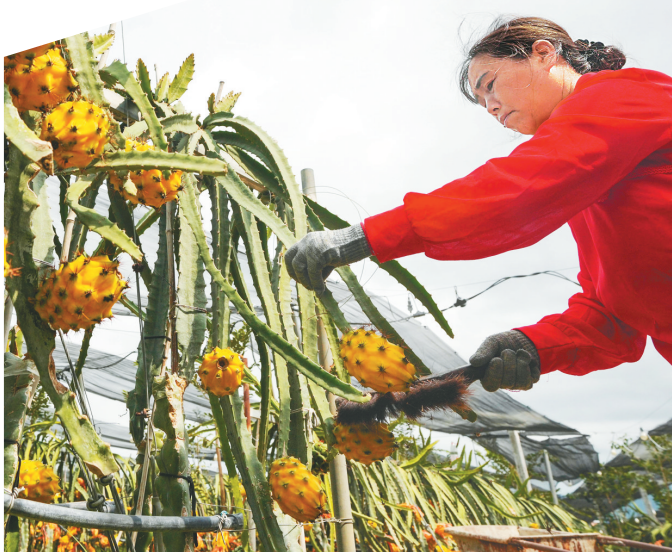
在乐东黎族自治县千家镇乐东创兴农业发展有限公司燕窝果基地,村民熟练地采摘着成熟的燕窝果。

不同时期的两组数据的对比可以反映出乐东的变化。据《乐东县志》记载：20世纪50年代初期，乐东农业总产值1000余万元，财政收入不足80万元。2024年，乐东全县地区生产总值达227.57亿元，城乡居民人均可支配收入137438元和21575元。