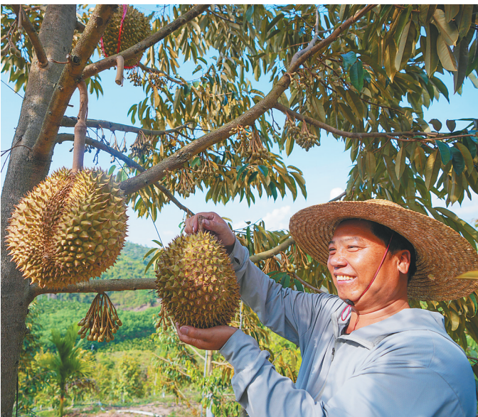
乐东琛源农业公司榴莲基地的错峰榴莲试种成功,农户举起榴莲开心不已。