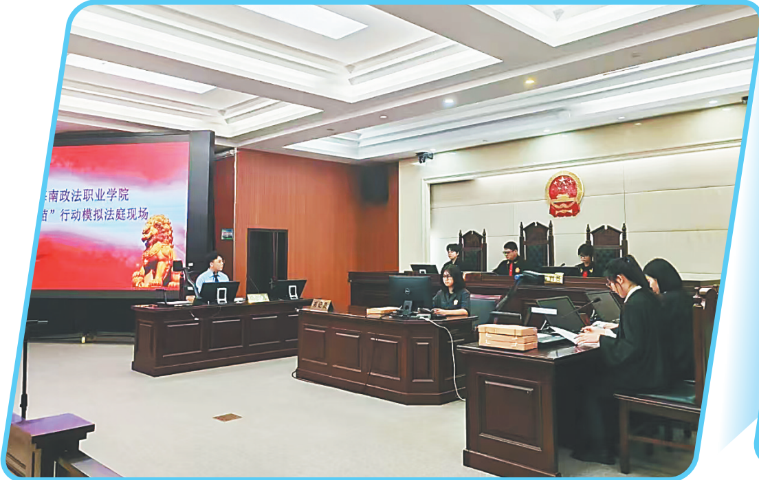
海南政法职业学院“护苗”行动模拟法庭现场。

社会治理是国家治理的重要方面。随着社会治理重心向基层的下移,传统法学教育和人才培养模式面临适应性挑战。海南政法职业学院立足国家治理现代化的总体战略、创新社会治理的现实需求和学院的办学定位,持续开展“懂管理、会服务、能创业、有技能”的人才培育工作,着力探索培养高质量复合型开放型基层社会治理人才,初步形成了具有自身特色的人才培养模式。