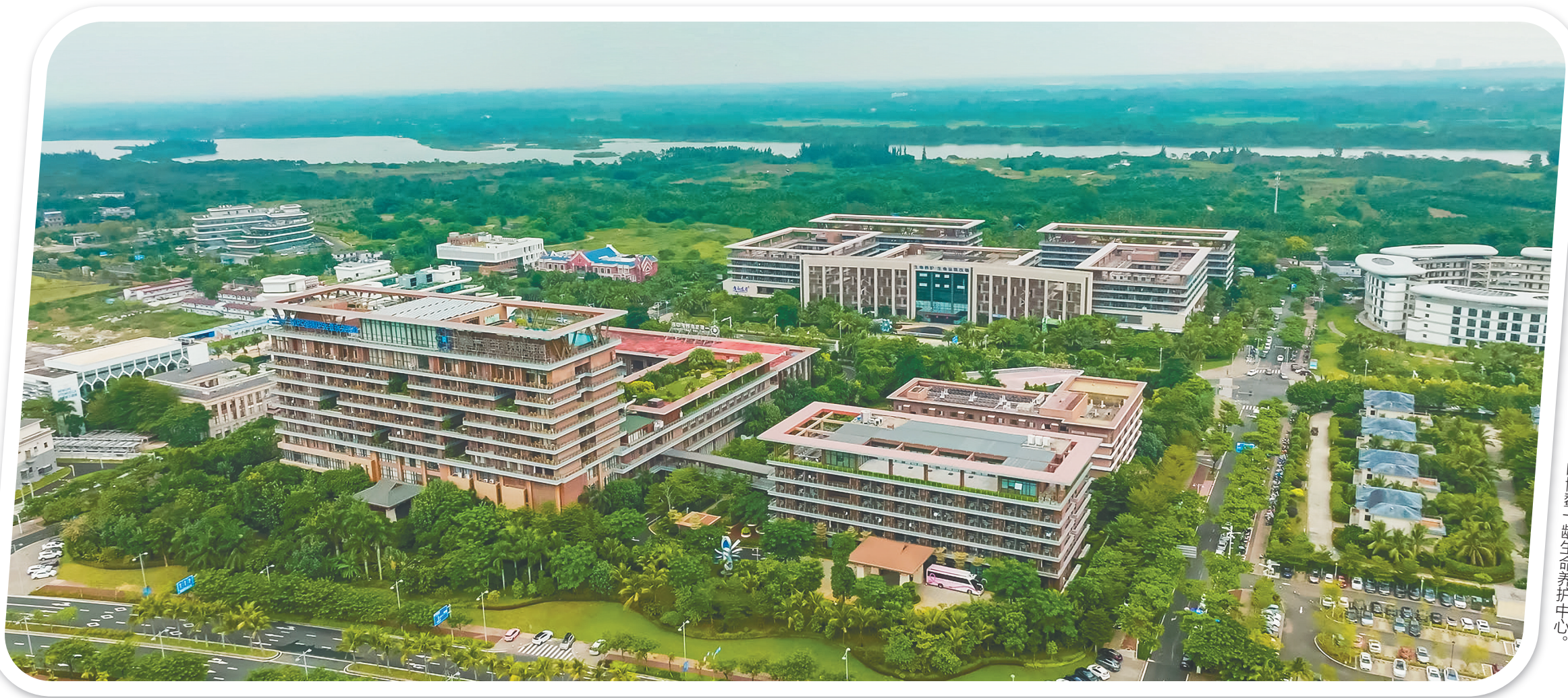
俯瞰位于乐城先行区的博鳌一龄生命养护中心。

从博鳌东屿岛出发，一路向北约20分钟车程，就来到博鳌乐城国际医疗旅游先行区。这里绿树成荫、花草成园，一龄旗下的生命养护中心、中法康复医学中心、博鳌超级中医院等医旅业态就坐落其间。 “这里和印象中的医院完全不一样。”不久前，来自意大利的网红荣茉莉在一龄生命养护中心亲身体验这里独特的内蒙古黄油茶酒疗法，更在传统针灸等中医疗法中，领略到东方医学的魅力。 事实上，从游客的体验来看，博鳌一龄生命养护中心更像是一个配套齐全的医养度假酒店。相比乐城先行区内的各大医院，这座“医养度假酒店”本身就极具创新。 “一龄为大家提供的是预防、治疗、康复等整合连续型的一体化服务，帮助大家真正做到‘未病先防’和‘已病早治’。”一龄集团董事长李玮说。 “未病先防”“已病早治”两手抓，凸显一龄坚持的主动健康方针。早在十多年前，一龄便由被动健康转向主动健康，由中医门诊转型向健康管理中心，探索大健康发展新路。