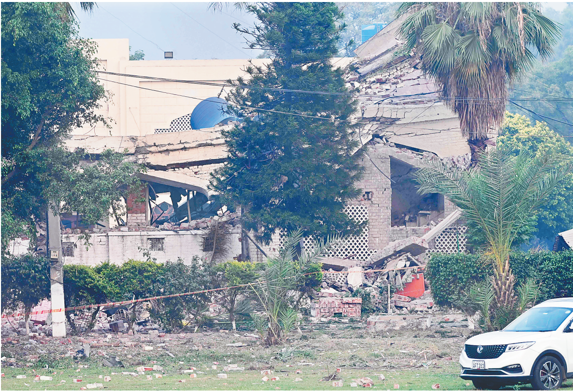
图为五月十七日在巴基斯坦旁遮普省穆里德盖拍摄的遭空袭被毁建筑。