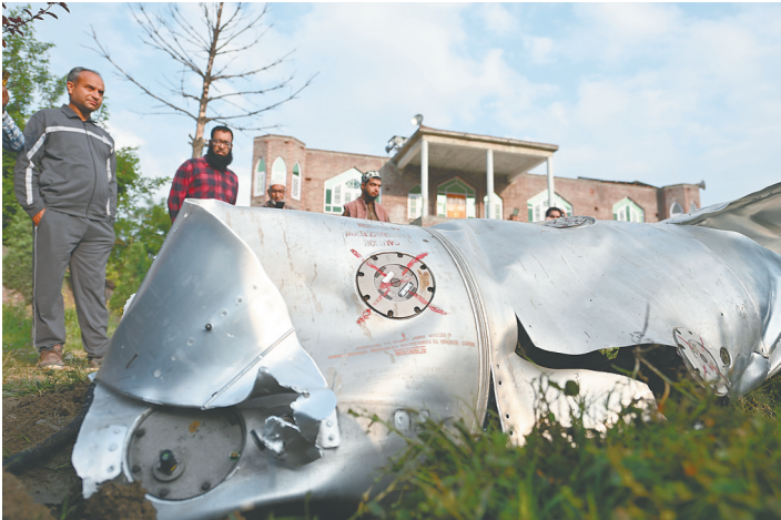
图为5月7日在印控克什米尔首府斯利那加附近的普尔瓦马地区拍摄的飞机残骸。

巴基斯坦总理夏巴兹·谢里夫7日在一份声明中说，“巴方完全有权对印度的‘战争行为’作出强有力回应”。巴军方称，将采取“空中和地面”行动予以回击。