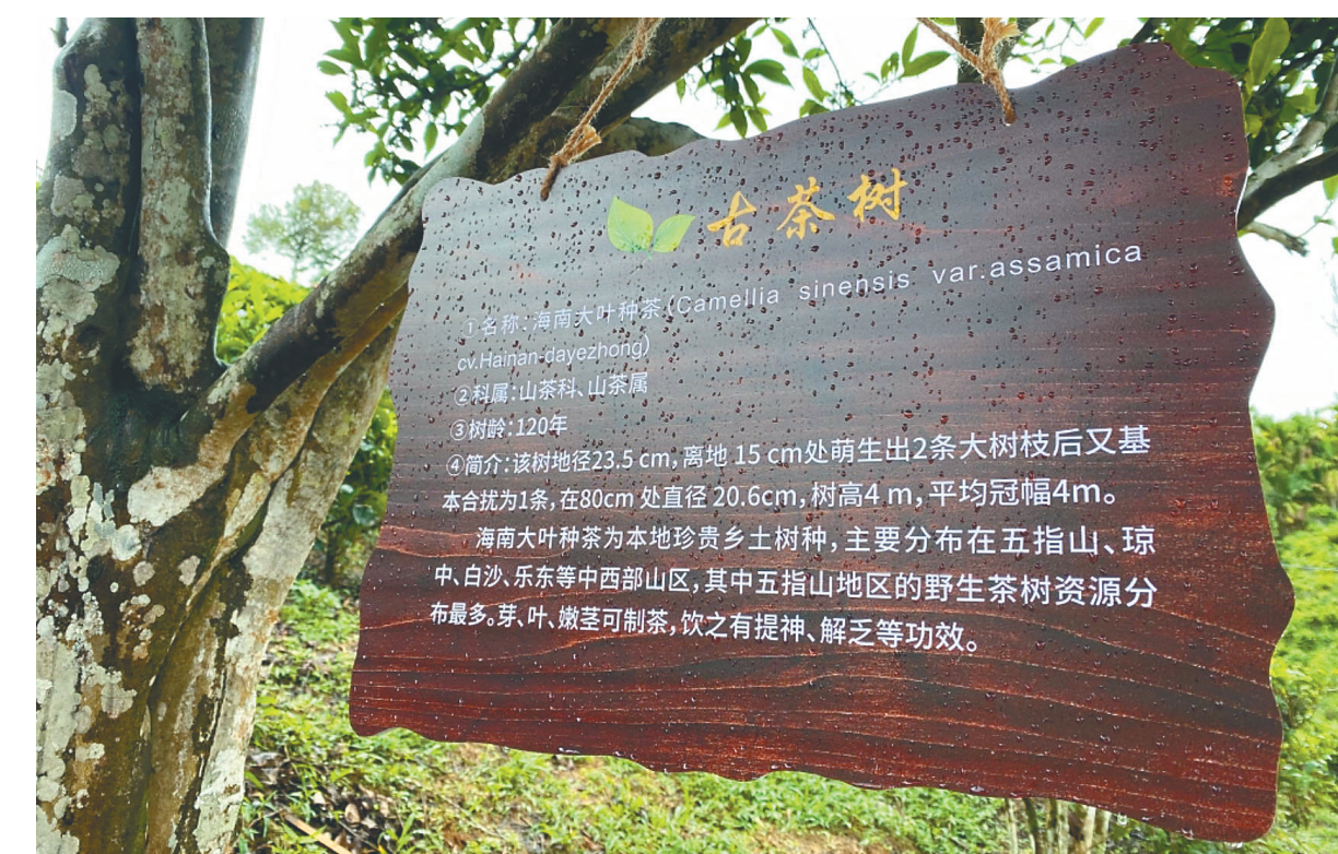
五指山市水满乡鹦哥岭有机茶园里，百年古茶树挂上了保护牌。

本报讯（海南日报全媒体记者孙慧）海南日报全媒体记者近日从海南省林业局获悉，为了更好地保护古树名木，我省将对古树名木全面实施挂牌保护，古树名木管护覆盖率达到100%。 海南古树名木资源丰富，树种多样。近年来，我省持续加大古树名木的保护力度，通过健全保护管理法规、落实古树名木营养责任、科学开展古树名木健康监测和抢救复壮等措施，古树名木保护取得明显成效。目前，全省共有古树名木17864株，其中一级保护古树155株、二级保护古树895株。 为实现“一树一档”精细化管理，我省要求对古树名木全面实行挂牌保护。近日，记者在海口、五指山、琼海等地发现，多棵古树名木都挂有保护牌，牌匾上标明了树木的种类、树龄、科属等内容，科普古树名木知识，提高群众认识，加强对古树名木的保护。