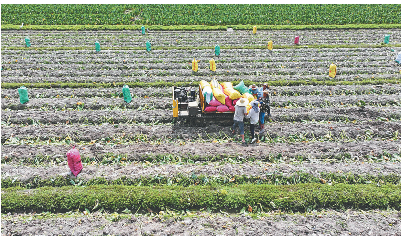
在定安县岭口镇封浩洋,工人正在采收红芽芋。

种植红芽芋800多亩,目前在定安累计种植红芽芋上千亩。”海南轩韵进出口贸易有限公司负责人傅利才介绍,翰林镇片区的红芽芋将陆续开始收获,“卖鲜芋,预计每亩产值8000元到1万元;加工成芋饺皮后,预计每亩产值2万元到2.5万元。”据了解,该企业还将在翰林镇富硒产业园内建设富硒红芽芋加工厂,包括分拣、加工、包装等厂房以及保鲜仓库和3座标准冷库,计划总投资300万元,主要生产芋头饺子、芋头条等深加工产品。目前加工厂已经完成场地平整等基础建设工序,预计今年7月厂房建设完成,10月将正式生产芋头饺子产品。