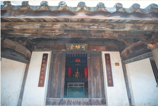
海口丘濬故居可继堂。