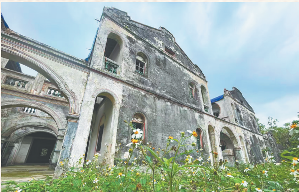
文昌符家宅。本版图片除署名外均为资料图