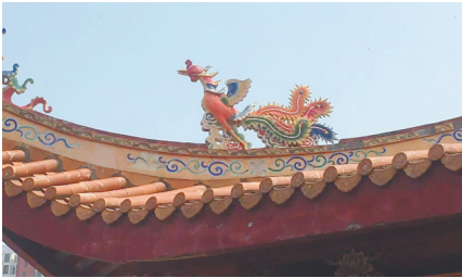
海口比干妈祖文化园妈祖庙上的凤脊兽。