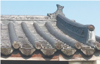
海口丘濬故居屋顶上的脊兽。