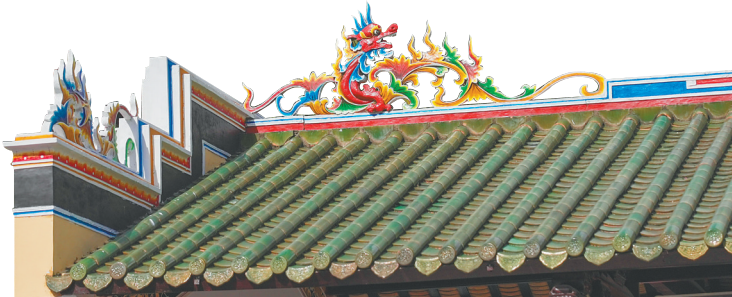
文昌一处祠堂上的龙脊兽。