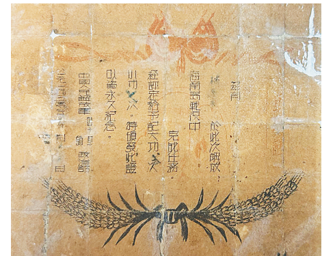
林年庆接应渡海大军,获得立功证书。

时光荏苒,在当年的白马井一带海岸登陆点上,已经建成今天的中国人民解放军第四野战军四十军第一潜渡登陆点纪念园,描绘渡海大军抢滩登陆的群像雕塑诉说着光辉历史。