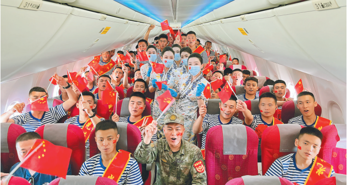
海南航空保障三沙退役军人离岛返乡包机航班。