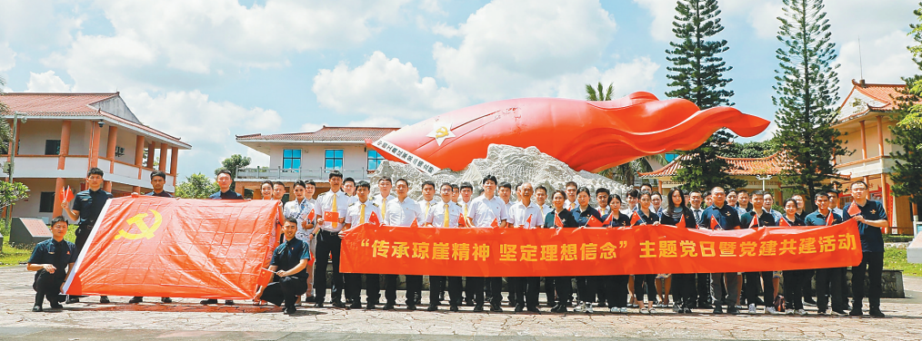
海南航空联合民航海南监管局组织开展“传承琼崖精神 坚定理想信念”主题党日活动暨党建共建活动。