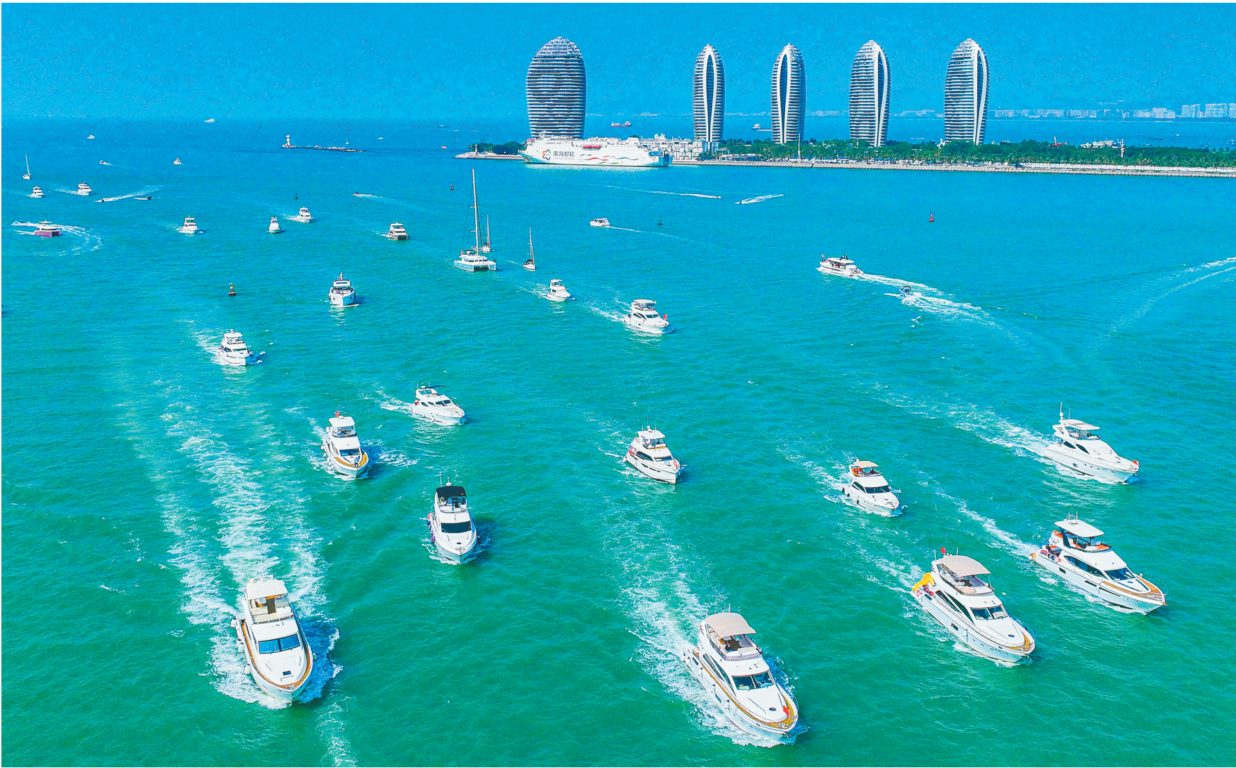
↑三亚,游艇出海。