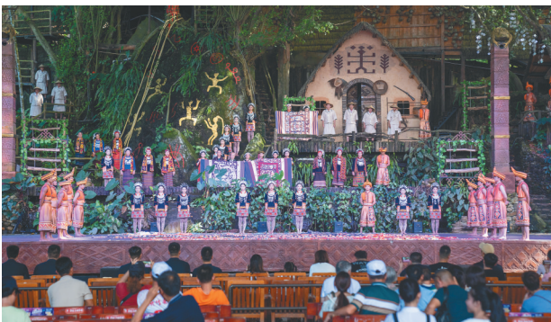
保亭槟榔谷表演。