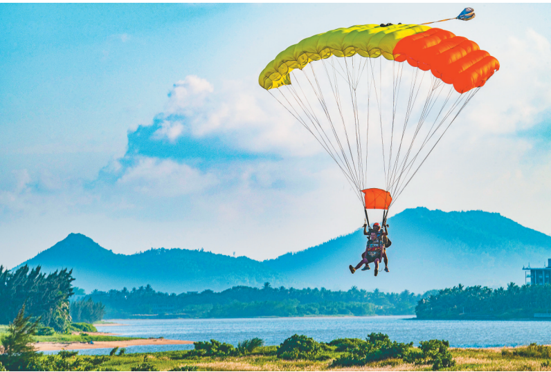
琼博鳌滑翔伞体验。

来海南旅游,玩什么?怎么玩? 有的人爱与水互动,尽情享受各种水上活动。或潜入海底,探索丰富多彩的珊瑚礁和热带鱼世界;或站在冲浪板上,挑战海浪,感受速度与激情的碰撞;或乘坐游艇,在海面上畅游,享受宁静与自由的时光。 有的人爱往山里钻,换一身装备,徒步在海南广袤的雨林之中,每一口呼吸都充满了负氧离子的清新。置身在吊罗山、尖峰岭、五指山、霸王岭以及鹦哥岭等热带雨林中,聆听大自然的交响乐,感受那份来自大自然的宁静与和谐。 有的人爱坐着发呆,喝着椰子水躺在吊床上,听着风吹树叶沙沙作响,悠悠晒太阳,享受着悠闲自在的时光。在海南,茶馆、咖啡店、小吃摊随处可见,人们可以在这里放松身心,与朋友和家人共度美好时光。 海南这么好玩,总要来看看。