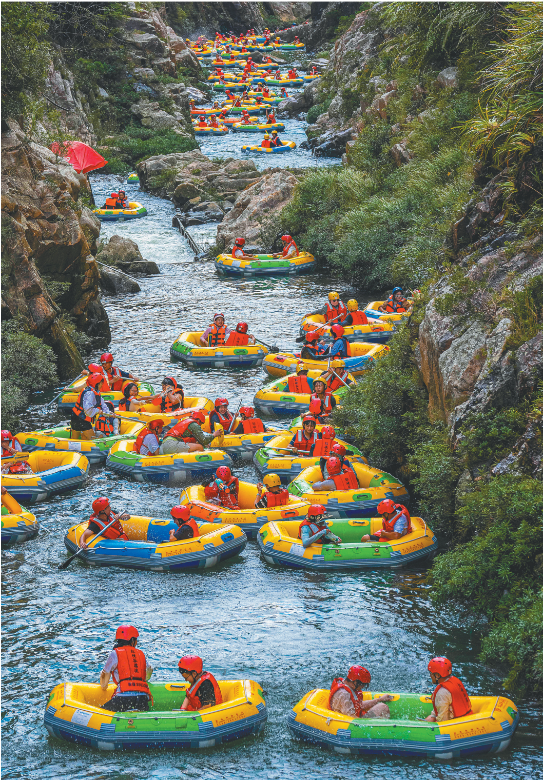
五指山红峡谷漂流。