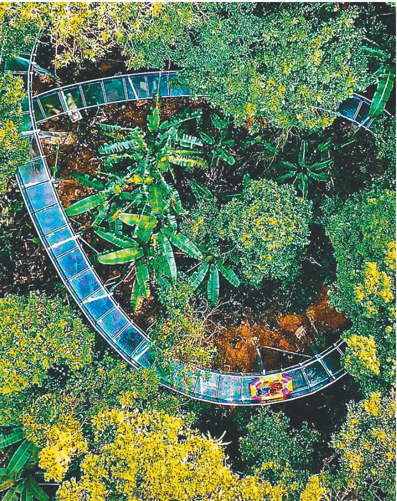
琼中百花岭雨林高空漂流。