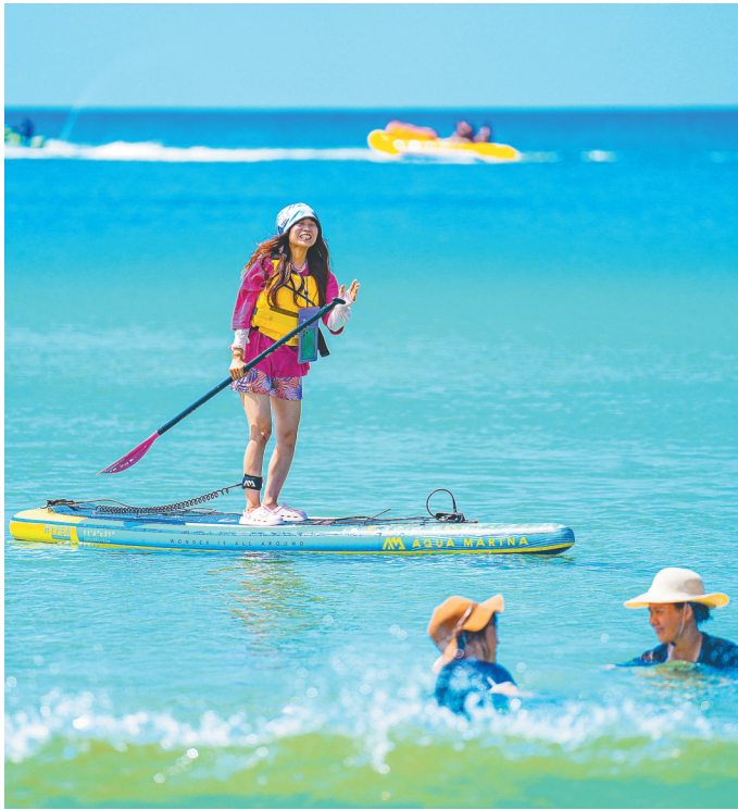
游客在万宁石梅湾体验桨板。