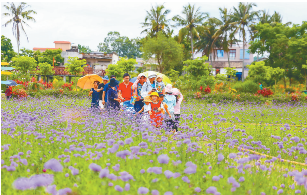
定安乡村田园游。