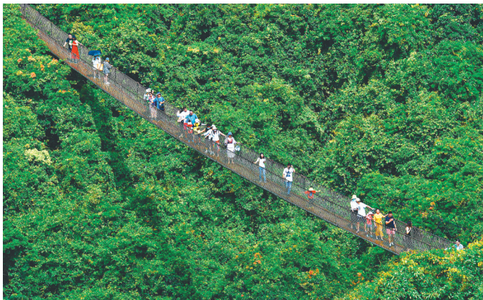
三亚热带天堂森林公园雨林漫步。黄庆优 摄