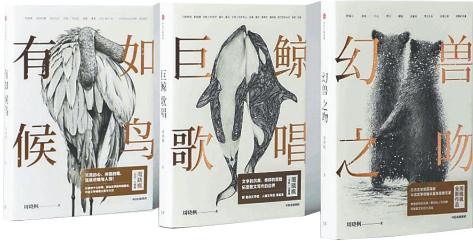
周晓枫的系列作品。