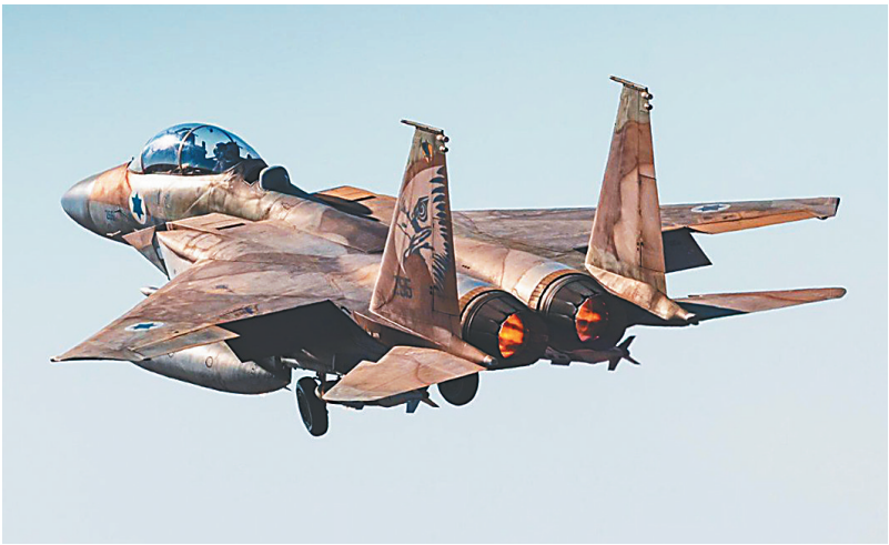
这张5月5日发布的未注明拍摄地点的照片显示,以色列空军战斗机飞往也门荷台达省执行空袭任务。

美国与伊朗正就伊朗核计划谈判,在伊朗是否能保留铀浓缩能力问题上的公开立场尖锐对立。美国中东