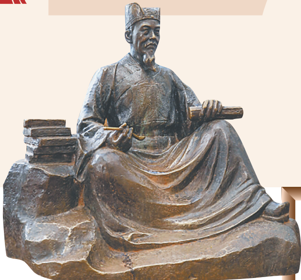
丘濬雕塑。

《群书钞方》是成书于明代成化年间的一部医书，作者是海南人丘濬。此古籍博采群方，虽为医书，但体例独特，录入各种医案轶闻，使得书籍生动而有趣。丘濬一生著作等身，在政治、学术上光华四射，相较之下，他的医学成就常常被低估，甚至鲜少被人提起。《群书钞方》一书，就是丘濬在医学领域的代表作。