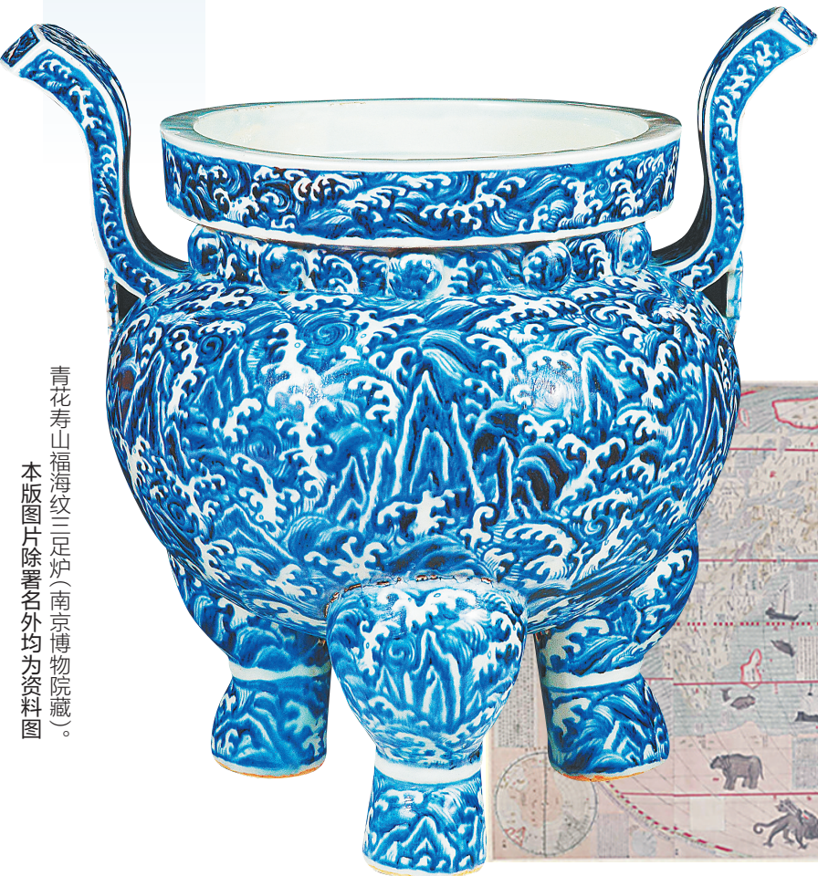
青花寿山福海纹三足炉（南京博物院藏）。

无论是中学西传还是西学东传，无论郑和下西洋还是利玛窦到中国，明代中国与域外文明的交流都在一定程度上改变了世界历史的发展进程。这种文明的互通共融，对于共同构建一个丰富多元的世界是至关重要的。