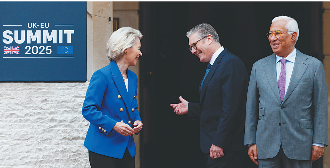
英国首相斯塔默(中)在伦敦与欧盟领导人举行会议前,同欧盟委员会主席冯德莱恩(左)交谈。

恩·冯·布格斯特多夫日前撰文指出,欧洲内部舆论正发生变化,在历来对以色列持支持态度的德国,最新民调显示大多数民众反对以色列在加沙地带的军事行动。民调结果显示,2024年6月,61%的德国人反对以色列在加沙地带的军事行动,而这一比例在2023年11月仅为31%。