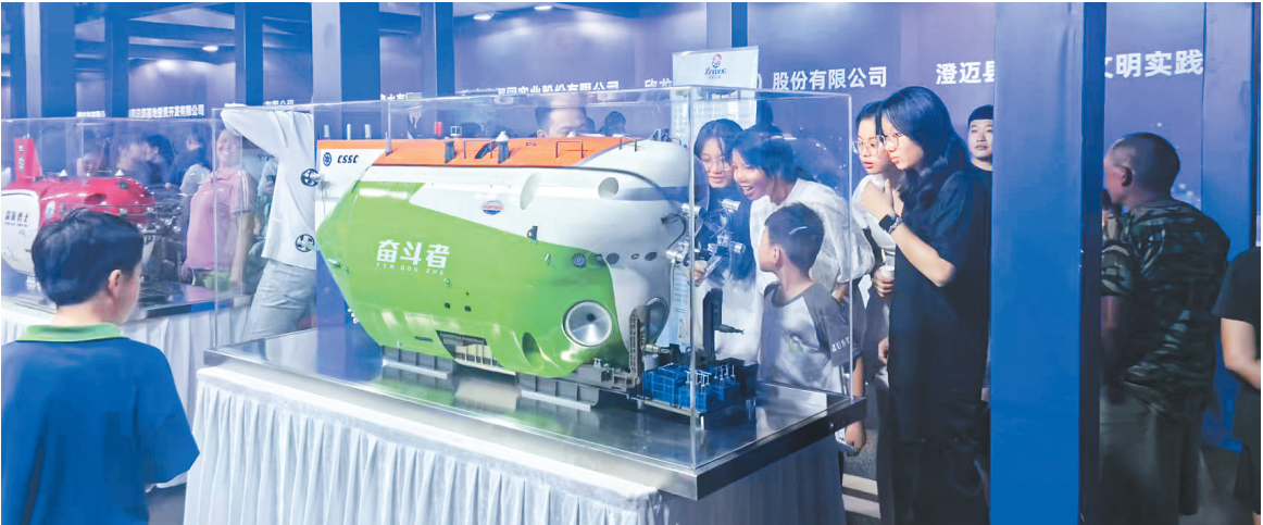
观众在“奋斗者”号模型前了解载人潜水器的奥秘。

近日，海南省第二十一届科技活动月和全国科技工作者日活动在澄迈启动。 活动现场，500架无人机同时升空，不断变换出机器人、“南繁种业”等图形和文字，将气氛推向高潮。现场还同步举办了科技成果展和科普大集市，为公众提供一场科普盛宴。