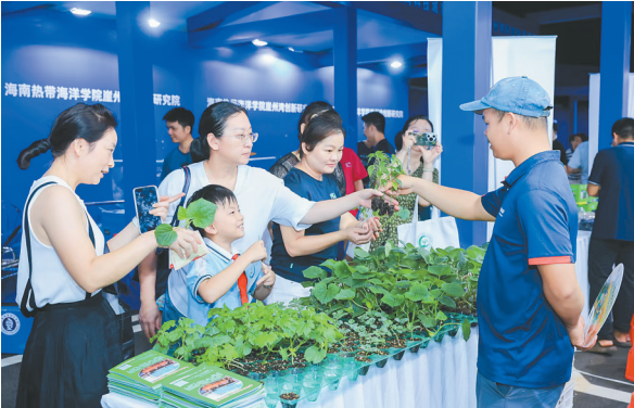
市民游客了解无土栽培蔬菜。