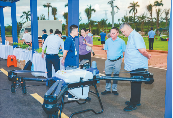
活动现场展示的无人机。