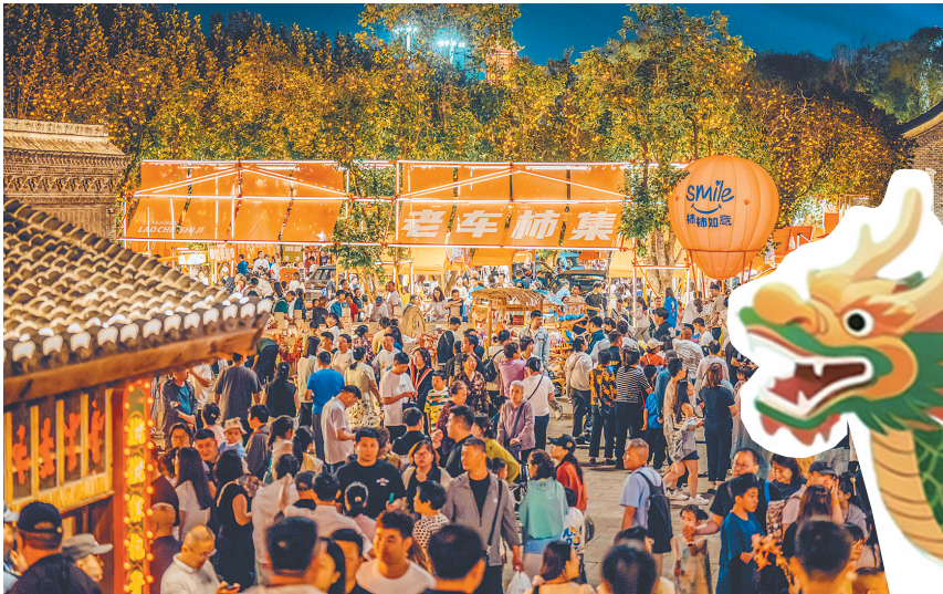
6月2日晚，游客在河北省唐山市丰南区河头老街景区游玩。