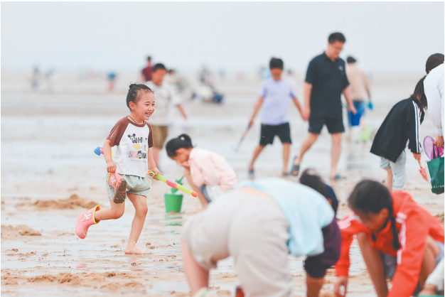
6月1日，孩子们在江苏省连云港市赣榆海州湾旅游度假区海边玩耍。

端午节假期3天 全国国内出游 1.19 亿人次 同比增长 5.7% 国内出游总花费 427.30 亿元 同比增长 5.9%