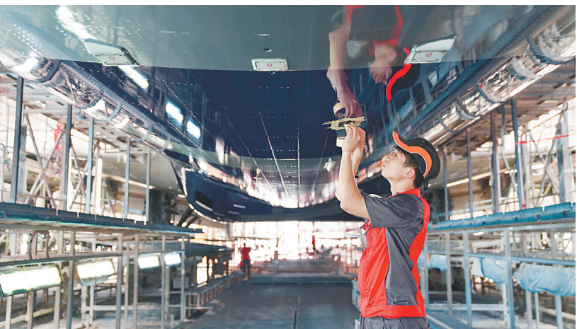
海航斯提斯技术人员在工作中。

本报讯(海南日报全媒体记者邵长春 通讯员闫梦晗 张健)近日,在海口一站式飞机维修产业基地,海航技术旗下海南海航斯提斯喷涂服务有限公司(以下简称海航斯提斯)完成一架波音 777 飞机的整机彩绘业务,这标志着海南自贸港顺利完成首单境外宽体机整机彩绘工作。 2024 年初,海航斯提斯与卡塔尔航空在海南自贸港签订了 3 年航空器