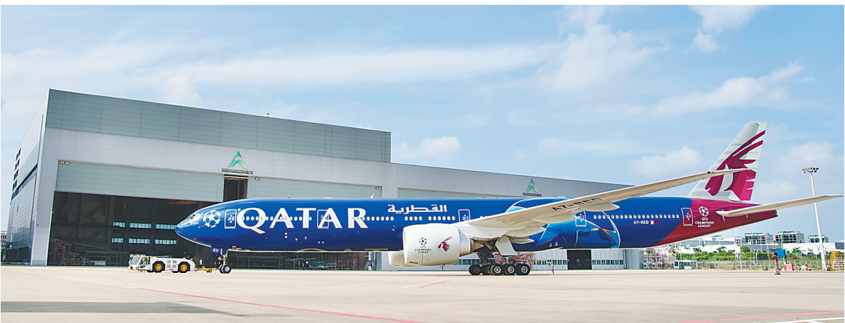
完成整机彩绘的卡塔尔航空波音 777 飞机。

喷漆业务合作协议,达成近 1 亿元人民币的订单。此次接受整机彩绘的波音 777 飞机,是卡塔尔航空为庆祝欧洲冠军杯圆满落幕而特别定制,该喷涂业务享受进境维修免保证金、进口维修航材保税等海南自贸港优惠政策。 “整机彩绘最重要的是广告图形定位,每个图形、LOGO、标识的位置必须精确无误。”海航斯提斯的机务工作者介绍,为全力保障此次喷涂工作,