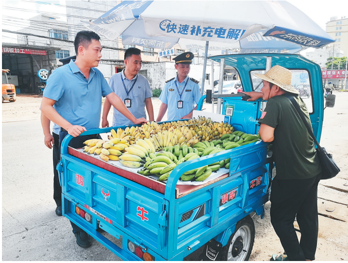
海口市综合行政执法局秀英分局执法人员耐心细致地与摊贩沟通。