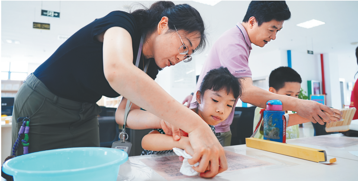
小记者在档案馆工作人员指导下学习档案修复技术。

本报海口6月8日讯(海南日报全媒体记者党朝峰)为迎接6月9日第18个国际档案日,6月8日,一场主题为“寻踪海南记忆 见证自贸新程”的“小记者对话档案”活动在海口市美兰区海府路的海南省档案馆举行。活动旨在通过青少年视角搭建档案与公众的沟通桥梁。小记者们走进档案馆,在参观珍贵档案、聆听历史故事、参与互动体验中,触摸海南发展脉络,感受档案“存史、资政、育人”的独特价值。 活动中,小记者们参观了“中国共产党人的家风”档案展,“时代印记 风华海南”城市风貌主题摄影展,“走进海南”大型档案文献展,见证中国共产党人的精神传承,海南发展轨迹以及琼岛千年沧桑巨变,这让他们惊叹家乡翻天覆地的变化。 小记者们带着好奇心,与档案馆工作人员“面对面对话”。工作人员现场演示档案修复技术,并通过“档案修复小课堂”,让孩子们亲身体验,实际操作,在实践中体会“档案管理”的严谨,同时让他们感受到:“原来档案不是‘沉睡的文件’,而是会‘讲故事’的历史证人!”