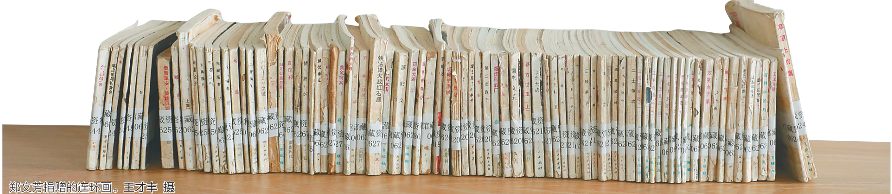
郑文芳捐赠的连环画。