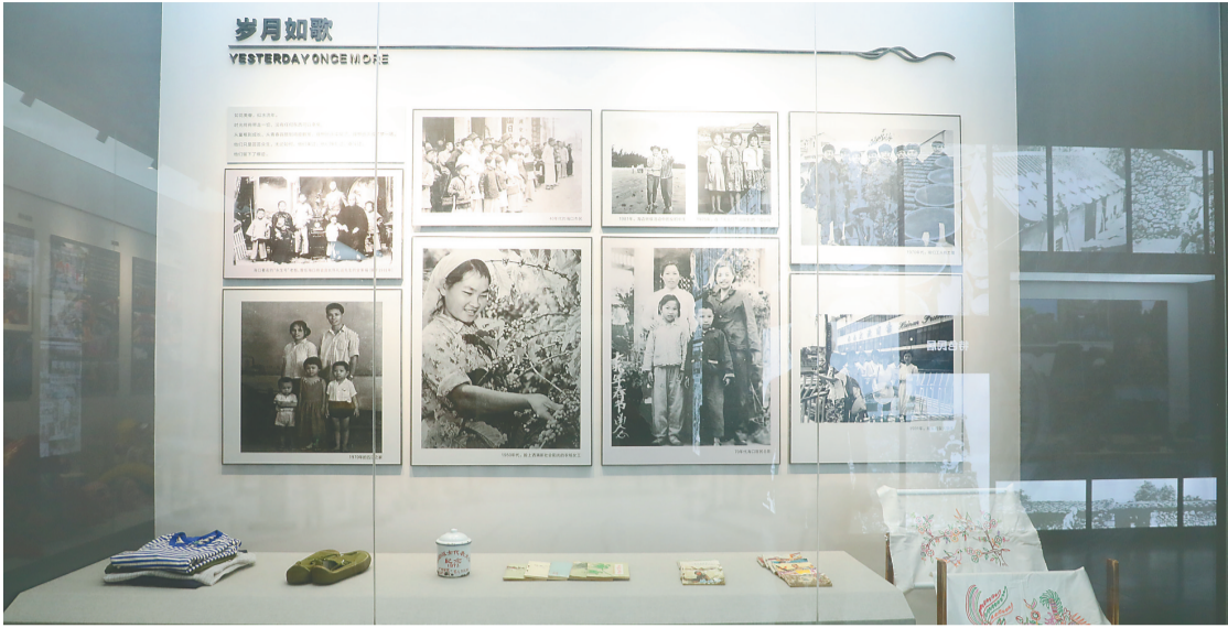
郑文芳捐赠和寄存在海口市档案馆的部分物品。