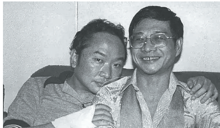
古龙(左)和倪匡。本版图片均为资料图

此外,古龙生前曾默默地为孤儿院大量捐款,他走后,朋友们决定把他著作收入的绝大部分捐赠给慈善机构。■