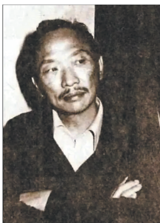
中国武侠小说宗师之一古龙。