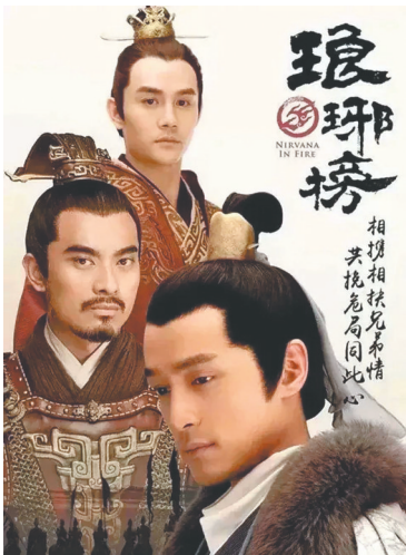
《琅琊榜》海报，与《藏海传》之间有异曲同工之处。

总体而言，《藏海传》是一部叙事周密、制作精良的权谋剧。较之于既往的权谋剧，《藏海传》加入了更多的悬疑和奇幻元素，可以说呈现出跨类型的叙事优势。与此同时，《藏海传》整合了更多的产业资源，实现了“流量明星+优秀文学IP+著名导演”的强强联合。而这些，正是权谋剧在新的时代语境下又一次更新迭代和踵事增华的体现。