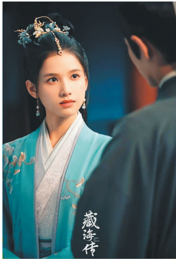
《藏海传》中的女性角色。

见尾的癸玺，还有各种人物隐藏的身份以及由此带来的猜谜游戏。例如，剧中一直强调在平津侯和曹静贤之外，藏海还有第三个仇人。藏海一直在寻找这个人的真实身份，这构成了剧情的重要组成部分。同时，当年的稚奴被面具人救出，这个面具人到底是何方神圣？他到底是正是邪？这个悬念一直到全剧剧情过半时依然没有揭晓。这些设定都给故事增加了很多变数和神秘色彩，也给观众提供了很多想象的空间。