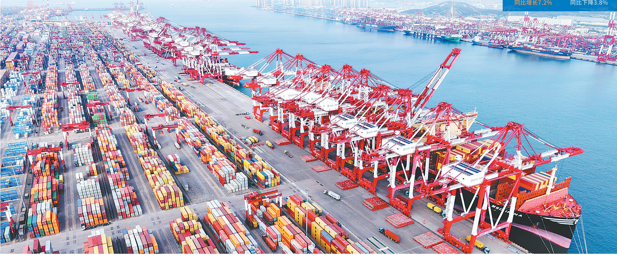
在山东港口青岛港，货轮在装卸外贸集装箱。

新华社北京6月9日电（记者魏玉坤）国家发展改革委近日研究确定并发布新一批国家骨干冷链物流基地建设名单，广州、杭州、盐田等19个国家骨干冷链物流基地入选。截至目前，国家骨干冷链物流基地数量达到105个，覆盖全国31个省（区、市）。 此次纳入建设名单的19个基地，在健全冷链物流网络、满足居民消费需求、引领冷链物流数字化绿色化转型发展等方面具有良好的示范带动作用。19个冷链基地纳入建设名单后，将进一步优化空间布局，有力支撑“四横四纵”国家冷链物流骨干通道网络建设，促进冷链物流规模化、集约化、组织化、网络化发展。 据悉，截至目前，国家发展改革委已累计发布5批国家骨干冷链物流基地建设名单，共105个基地，完成《“十四五”冷链物流发展规划》确定的到2025年布局建设100个左右国家骨干冷链物流基地的目标任务。下一步，国家发展改革委将在前期工作基础上，指导各地高质量推进国家骨干冷链物流基地建设，“以点带面”不断提升冷链物流体系规模化、集约化、组织化、网络化运行水平，有效提升冷链产品价值链，支撑城乡居民消费提档升级。