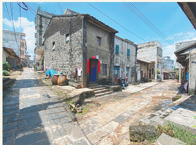
海口市石山镇北铺墟一角。