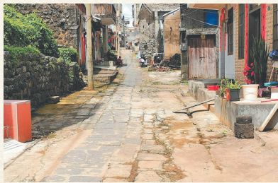
海口市石山镇北铺村的石板道。