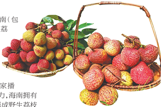
妃子笑(左)和仙桃荔。

辈”。在已经选育出荔枝王和无核荔枝的基础上,科研人员近年来又以荔枝王和无核荔枝分别作为母本和父本,仙桃荔和巨美人这些新品种陆续被选育出来。相比上一代的荔枝王,仙桃荔和巨美人上市时间更早,果实品质也综合了母本和父本的优质特性。