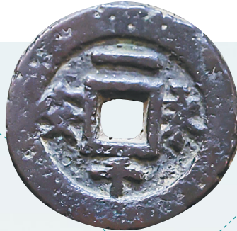
五代十国时期的古钱币“永安一千”。