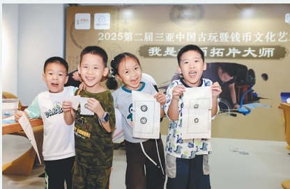
孩子们参与“我是钱币拓片大师”活动。

值得一提的是,博览会现场设置了银锭展区。“银锭”是对古代白银货币的俗称,唐宋时称“铤”,“元宝”之称始于元,明代初期称“银铤”,后期税收银主要是五十两马蹄形大银锭。清代各省铸造的银锭成色稍有不同,大小形状各异,各地缴税