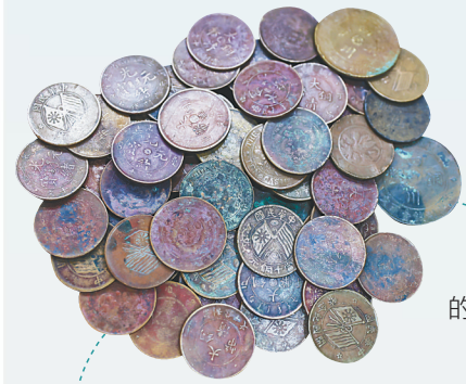
清末民国时期的机制铜元。