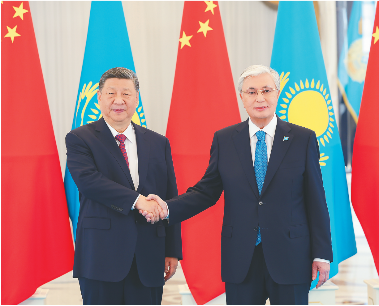
当地时间六月十六日下午，哈萨克斯坦总统托卡耶夫同中国国家主席习近平在阿斯塔纳总统府举行会谈。

新华社阿斯塔纳6月16日电(记者倪四义 胡晓光)当地时间6月16日下午，哈萨克斯坦总统托卡耶夫同中国国家主席习近平在阿斯塔纳总统府举行会谈。