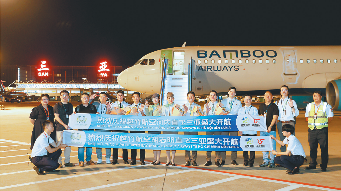
六月十五日至十六日,三亚凤凰国际机场连续开通三亚往返越南胡志明市、河内市的定期国际客货运航线。

近年来,三亚持续举办面向东南亚的“请进来”活动,邀请各国旅行商、媒体、企业代表深入了解三亚市场和政策优势。新航线的通达性将进一步提升活动实效,吸引更多东南亚资源汇聚三亚,为三亚打造“东南亚朋友圈”注入新活力。接下来,三亚还将持续巩固中亚市场,如推动“三亚⇌阿斯塔纳”航线加密,并稳步拓展欧美市场,探索开通“三亚⇌曼谷⇌法兰克福”第五航权航线,打造覆盖东南亚、日韩、中亚及欧美等多元国际客源市场的新格局,增强三亚与世界的互联互通,进一步丰富境外游客结构。