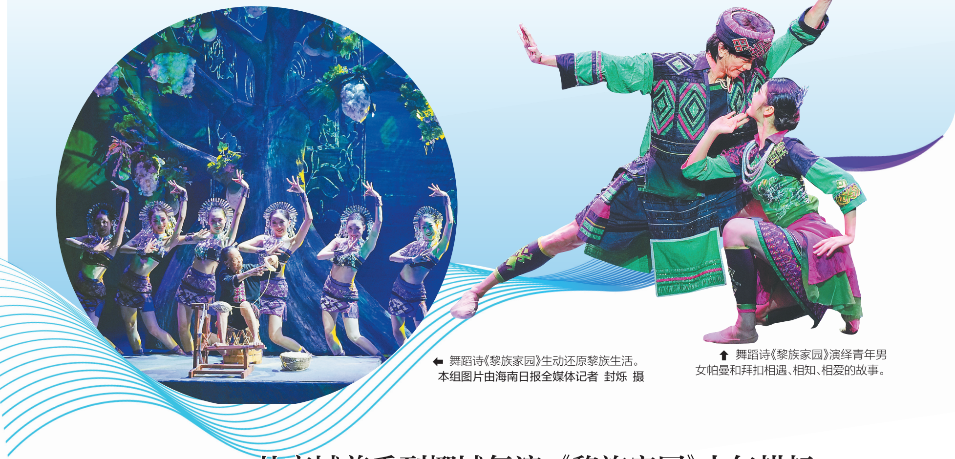
舞蹈诗《黎族家园》生动还原黎族生活。