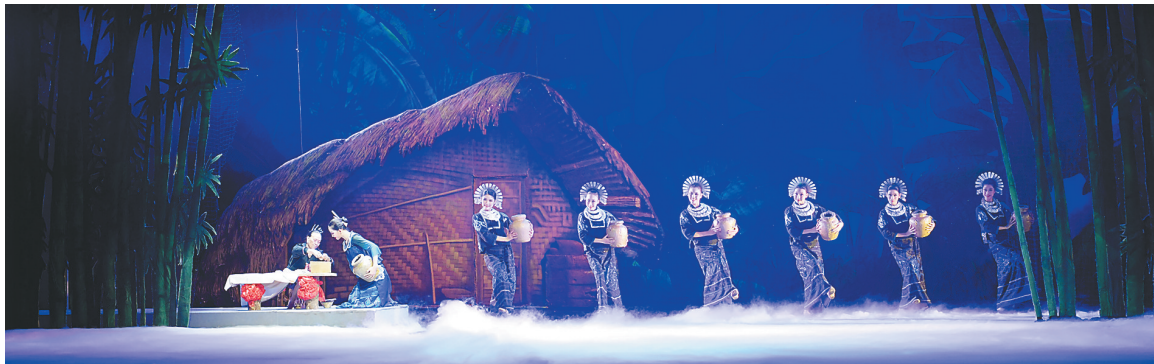
《黎族家园》曾于2021年在上海演出。

十年耕耘，《黎族家园》成为黎族文化的生动载体。这部作品不仅是舞台上的艺术长卷，更是民族文化传承的鲜活样本，它见证着艺术工作者对传播海南文化的执着，也诉说着少数民族文化走向大众、走向世界的可能。