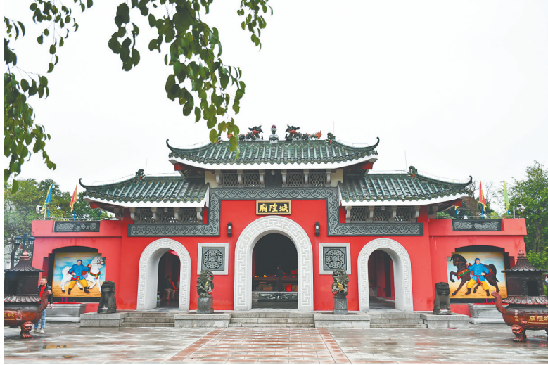
琼海乐会古城的城隍庙。