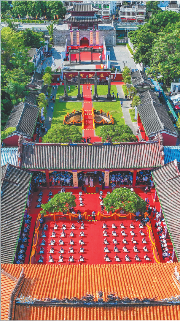
三亚崖城学宫。

从汉代中原王朝在海南岛上建郡设县,到如今崖州故城、定安故城等古城在自贸港建设的背景下焕发新活力,琼州古县治的兴衰变迁史,便是一部浓缩的海南发展史。