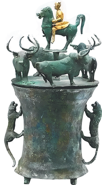
西汉鎏金四牛骑士贮贝器。 本版图片除署名外均为资料图

在云南省博物馆里,有一件非常有意思的馆藏:一个普普通通的青铜罐子,束腰却配上了两只向上攀登的猛虎,而罐子的盖子更是尽显复杂华丽,四头逆时针奔跑的公牛环绕在盖子边缘,在牛角的簇拥下,一名金灿灿的骑士端坐在马背上。在猛虎与公牛的衬托下,骑士的形象愈发显得英姿飒爽。这个罐子有一个复杂的名字,叫“西汉鎏金四牛骑士贮贝器”,所谓“贮贝器”,换成今天的话来说就是“存钱罐”,看起来,“存钱”这项活动不仅是现代人喜欢,就连古人也对此乐此不疲。