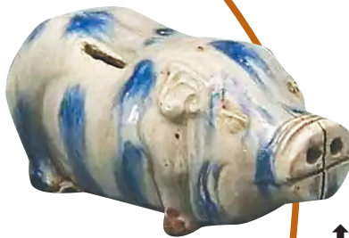
↑清代石湾窑扑满。 广东省博物馆收藏

发现了装满钱币的陶罐,这也许便是当时人们的存钱罐,那时的人们把辛苦攒下的钱装在陶罐里,为安全起见埋在了地下,却不料或是遭遇天灾、或是罹经兵燹,主人一去不返,而存钱罐却依然默默地坚守着。