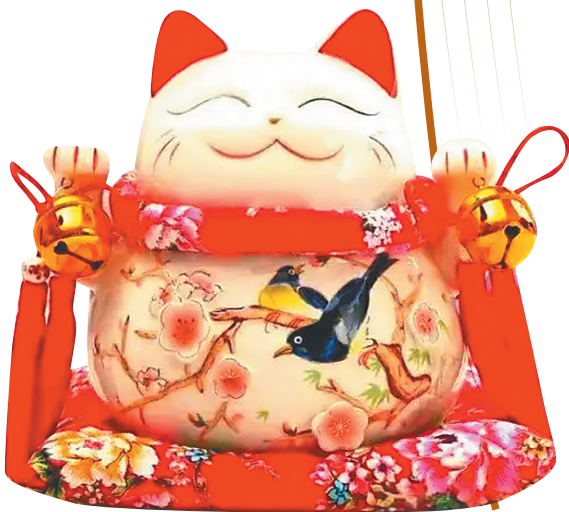
招财猫起源于日本江户时代一种名为“猫又”的神秘生物的传说,后形成象征好运与财富的文化符号。