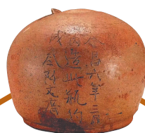
←唐代长沙窑青 釉会昌六年铭扑满。 湖南博物院收藏