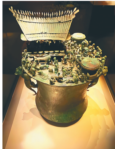
祭柱场面铜贮贝器。祭柱即为祭祖,场景为正在进行中的祭礼。

当然,随着虚拟货币时代的到来,存钱罐也不能再墨守成规,其实,在一些电子平台上,已经推出了不少带有存钱罐功能的产品,但是,当可触的货币变成了一个个数字,在需要使用时,那种“打破扑满”的仪式感却荡然无存,这不能说不是一个遗憾。取一枚硬币,投入存钱罐,投下的不只是钱财,更是一种希望,一种愿景,在可见的未来,存钱罐还将和人们一起朝着幸福的方向走下去。图