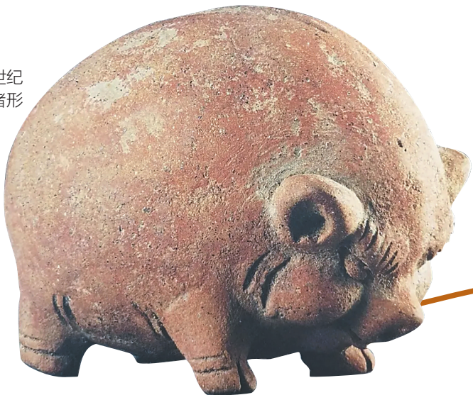
历史悠久的存钱罐