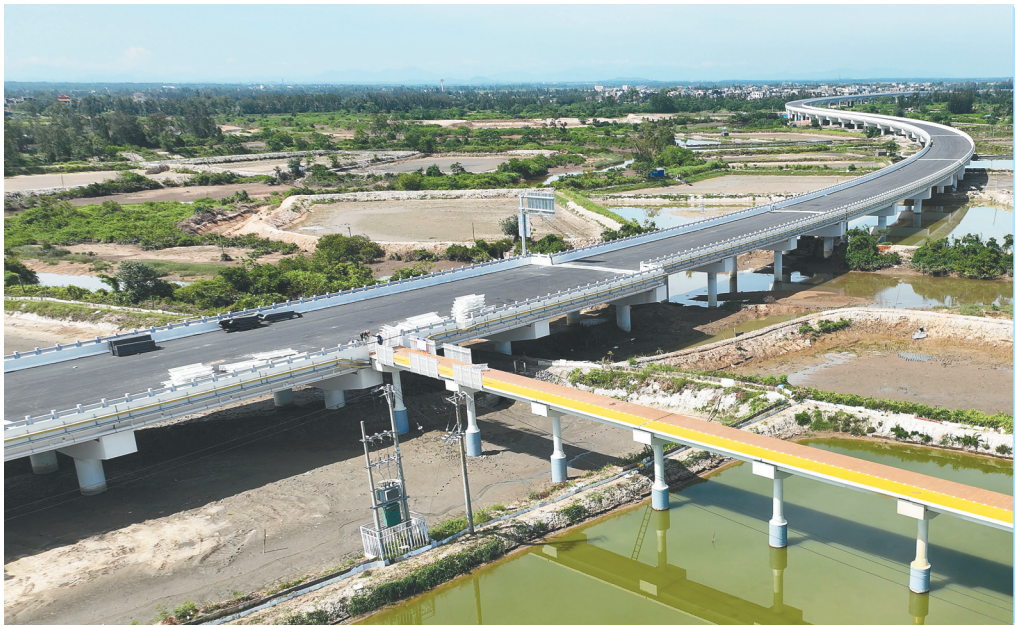
儋州：北门江特大桥 新颜初现

指引、选编典型案例,为全省执法人员办案提供“活教材”和“标准答案”;加强省营商环境部门与政务监管统筹,会同有关部门积极推动监管事项清单、执法事项清单和“双随机、一公开”清单动态调整,建立完善监管与执法的无缝衔接机制,统筹推进全省政务信息互联互通,以信息化带动监管执法规范化。要强化自身建设,以专业能力为根基、纪律作风为铠甲、技术赋能为支撑、人文关怀为纽带,构建“选、育、管、用”全链条队伍培养体系,锻造一支忠于法律、精于业务、敢于担当、人民信赖的自贸港综合行政执法铁军。 副省长蔡朝晖,省政府秘书长符宣朝参加会议。