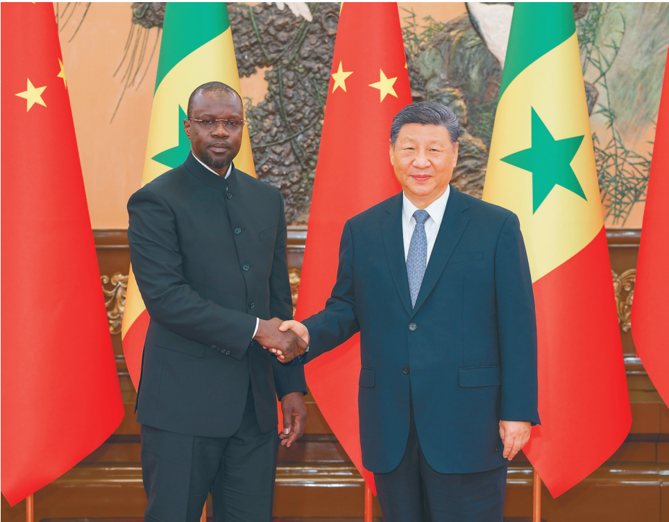
6月27日上午,国家主席习近平在北京人民大会堂会见来华出席夏季达沃斯论坛的塞内加尔总理松科。

新华社北京6月27日电(记者邵艺博)6月27日上午,国家主席习近平在北京人民大会堂会见来华出席夏季达沃斯论坛的塞内加尔总理松科。