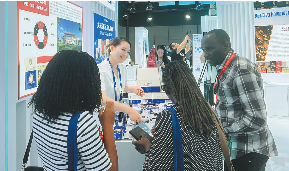
6月27日,第二届中国国际中小企业博览会在广州开幕,图为外籍展商在了解海南企业参展产品。

当天开幕式上还发布了第三批中小企业数字化转型试点城市名单,儋州市入选;同时还发布了全国中小企业数字化转型“百城试点”名单,海