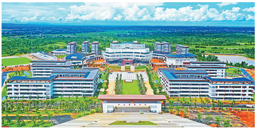
海南警察学院。

据悉，海南警察学院位于海口市秀英区定海大道1号，是一所由海南省政府举办、省公安厅主管、省教育厅负责业务管理与指导的公办普通本科高等学校，也是海南首个公安类本科院校。今年首批计划面向海南省招收高级中