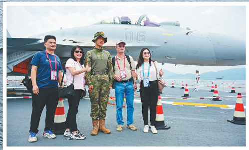
7月5日，民众在海军山东舰上留影。