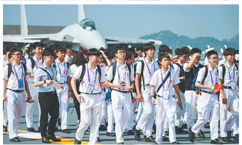
7月4日，山东舰对香港青少年学生开放。