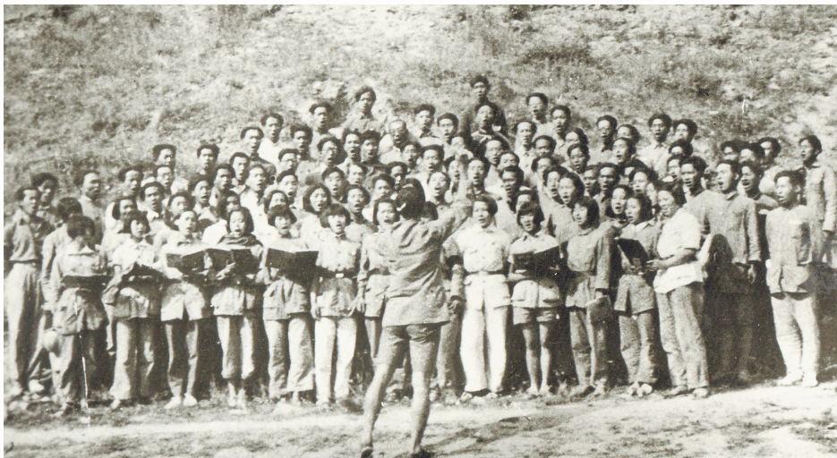
一九三九年冼星海指挥鲁迅艺术学院学员排练《黄河大合唱》。

1936年，与冼星海、聂耳并称“音乐三杰”的艺术家张寒晖在西安街头目睹成千上万士气低落的东北军将士和无家可归的东北同胞，听闻他们高呼打回东北、赶走日寇的声音，被深深触动，创作了引发广泛共鸣的《松花江上》：“九一八，从那个悲惨的时候，脱离了我的家乡……哪年哪月，才能回到我可爱的故乡？”这首歌如泣如诉，感人肺腑，表达了南迁的东北民众渴望回到家乡的心情，至今仍是名曲。