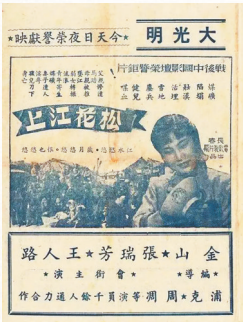
电影《松花江上》海报。 本版图片均为资料图