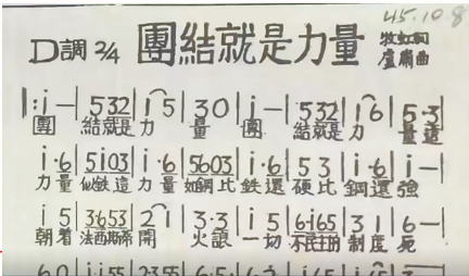
1945年发表在报刊上的《团结就是力量》。