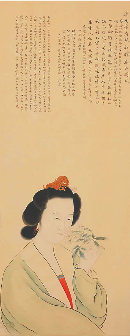
李清照肖像画，藏于国家博物馆。

近日，民族歌剧《李清照》在“2025 国家大剧院歌剧节”期间连演两场，引发了诸多关注。李清照，这位有着“千古第一才女”“中国古代伟大女诗人”之称的伟大女性，在时间的漫长流逝中，她的迷人越发凸显。有资料显示，李清照于1155年5月12日逝世，若以此推算，李清照已经逝世870周年。在近900年的时光里，她的形象其实是模糊的，与此同时，过于少量的史料，让她的形象更富想象的空间。于是，我们习惯性地用她的诗词去想象她和她的人生。