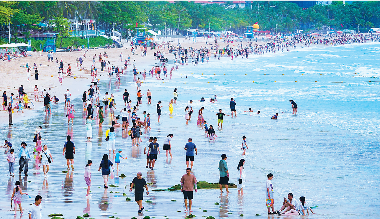
漫步海滩 慢享清凉

南样板”。希望大家帮助海南拥抱前沿发展思路和最新科技成果,制定战略举措、招商引资引才,共同为建设海洋强国、交通强国、航运强国目标作出更大贡献。 本次活动以“绿色航海 向新图强”为主题,发布了2024中国航运发展报告、“引领航运绿色低碳智慧发展新趋势”倡议书;公布了2025年度安全诚信航运公司、船舶名单,2025年航海领域全国劳动模范和先进工作者名单,2024年中国航海学会科学技术进步奖和技术发明奖。 国际海事组织(IMO)秘书长阿塞尼乌·多明格斯视频致辞。交通运输部副部长付绪银、海南省副省长顾刚等参加有关活动。