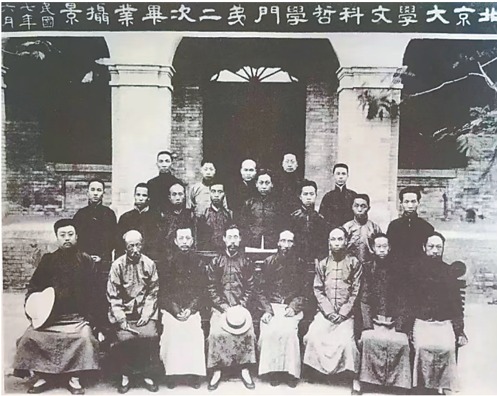
1919 年 6 月,冯友兰(二排左四)与老师和同学合影留念。

我经常去罗老师那里看书。他的藏书中就有冯先生的《中国哲学史》《新理学》《新事论》等。特别是《新事论》各篇,简明扼要,说理透彻,我一个高小学生,竟然一口气读完了这本书,在我幼小的心灵中,始终觉得冯先生是个有学问的哲学家。